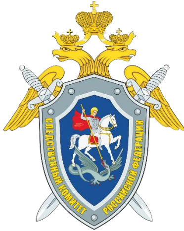
Следственный комитет Российской Федерации